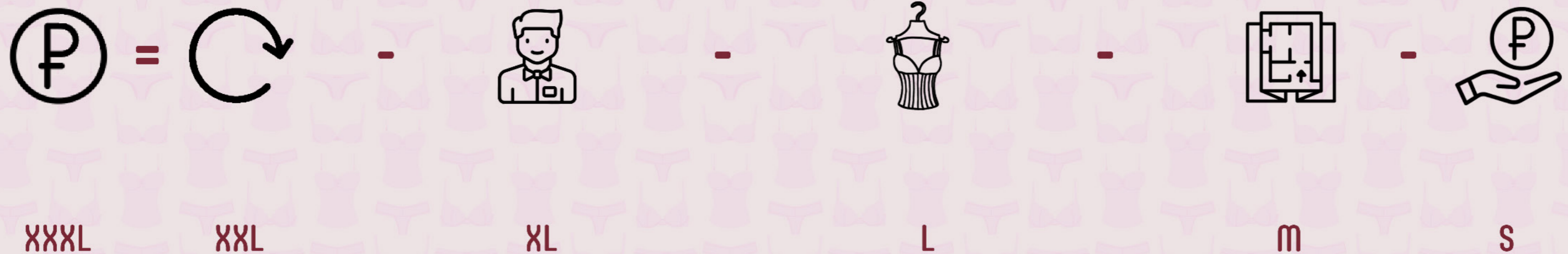
Схема доходов наших филиалов классическая для большинства торговых предприятий и укладывается в формулу:

ДОХОД = ТОВАРООБОРОТ – ЗАРПЛАТА ПЕРСОНАЛА – ДЕНЬГИ НА ЗАКУПКУ ТОВАРА – АРЕНДНАЯ ПЛАТА – НАЛОГИ.